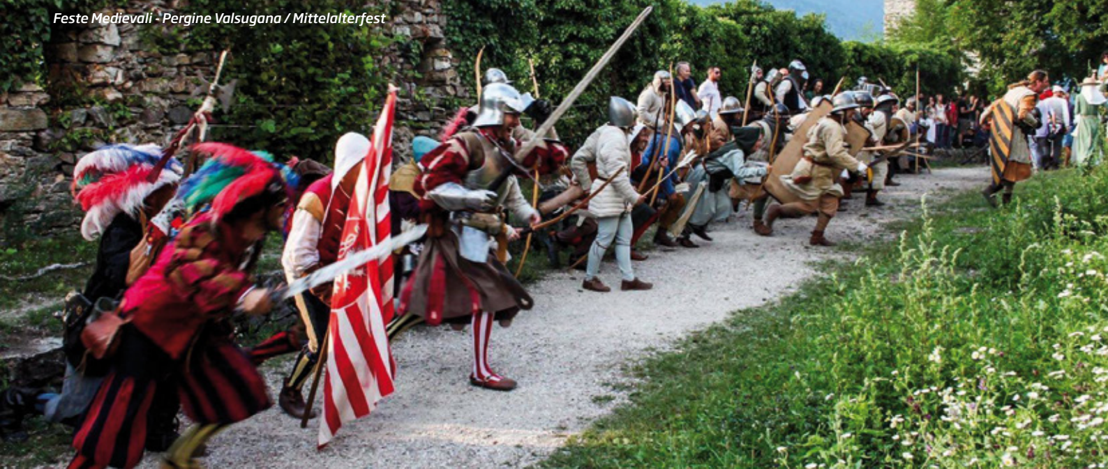
Feste Medievali - Pergine Valsugana / Mittelalterfest

Piazza Serra, 2 - 38057 Pergine Valsugana Cell. +39 347 0685545 - Fax +39 0461 531788 info@palazzochimelli.it www.palazzochimelli.it