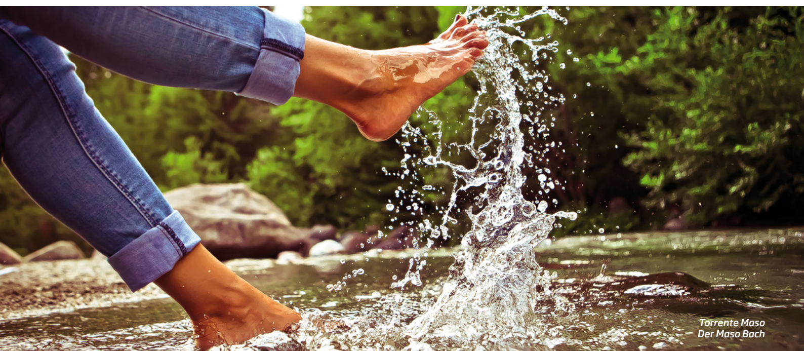
Torrente Maso Der Maso Bach

Loc. Desene - 38050 Ronchi Valsugana Tel. +39 3490844709 chalet.serena@gmail.com www.chaletserena.com