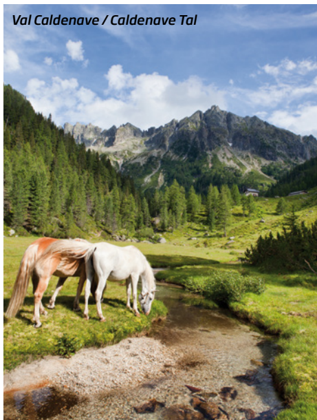
Val Caldenave / Caldenave Tal