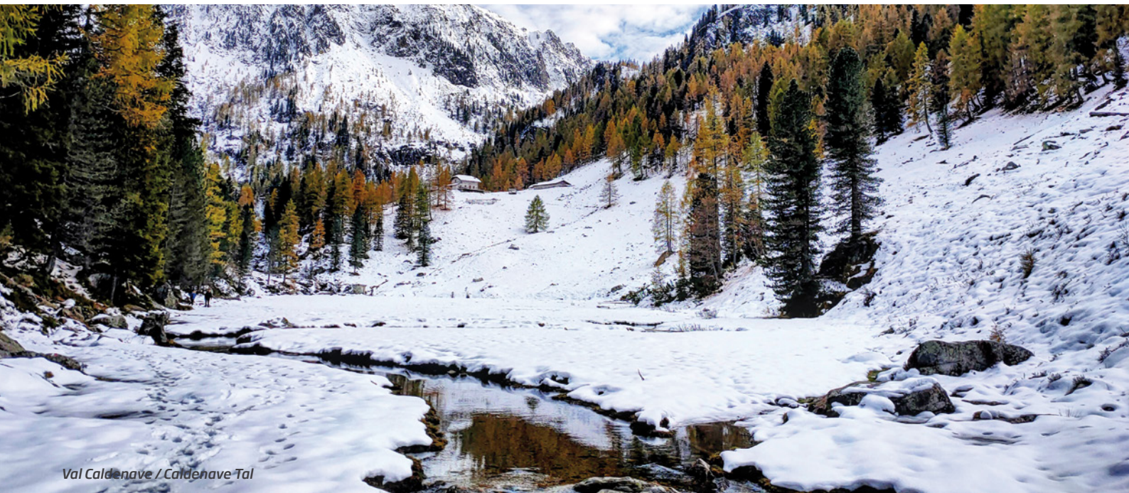
Val Caldenave / Caldenave Tal

Altitudine 1792 m slm Località Caldenave - 38050 Scurelle Cell. +39 340 6351259 rifugio.caldenave@gmail.com mountbnb.com/it/452/rifugio-caldenave-4