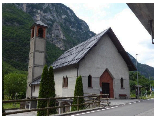
PUNTO 1 – LUGO DI PARTENZA: CHIESA PIANELLO

Di seguito documentazione fotografica di alcuni passaggi suggestivi.