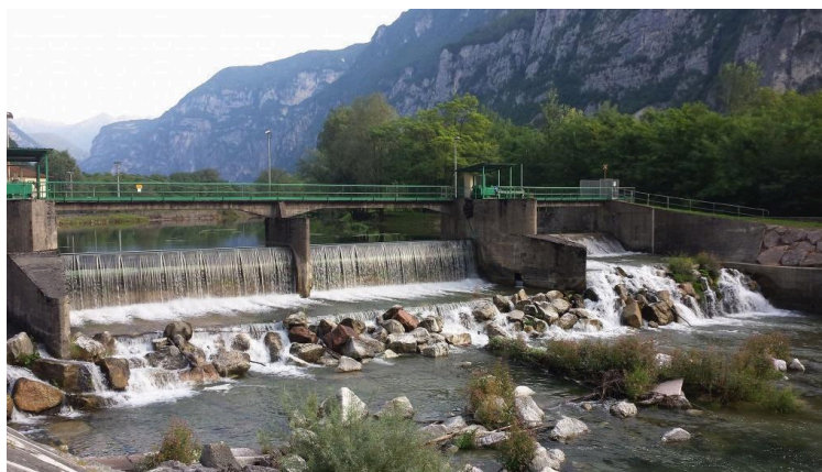
PUNTO 2 – DIGA PIANELLO SUL FIUME BRENTA