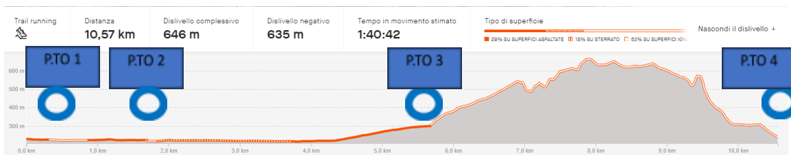
SKYLINE PIANELLO VERTICAL RUN