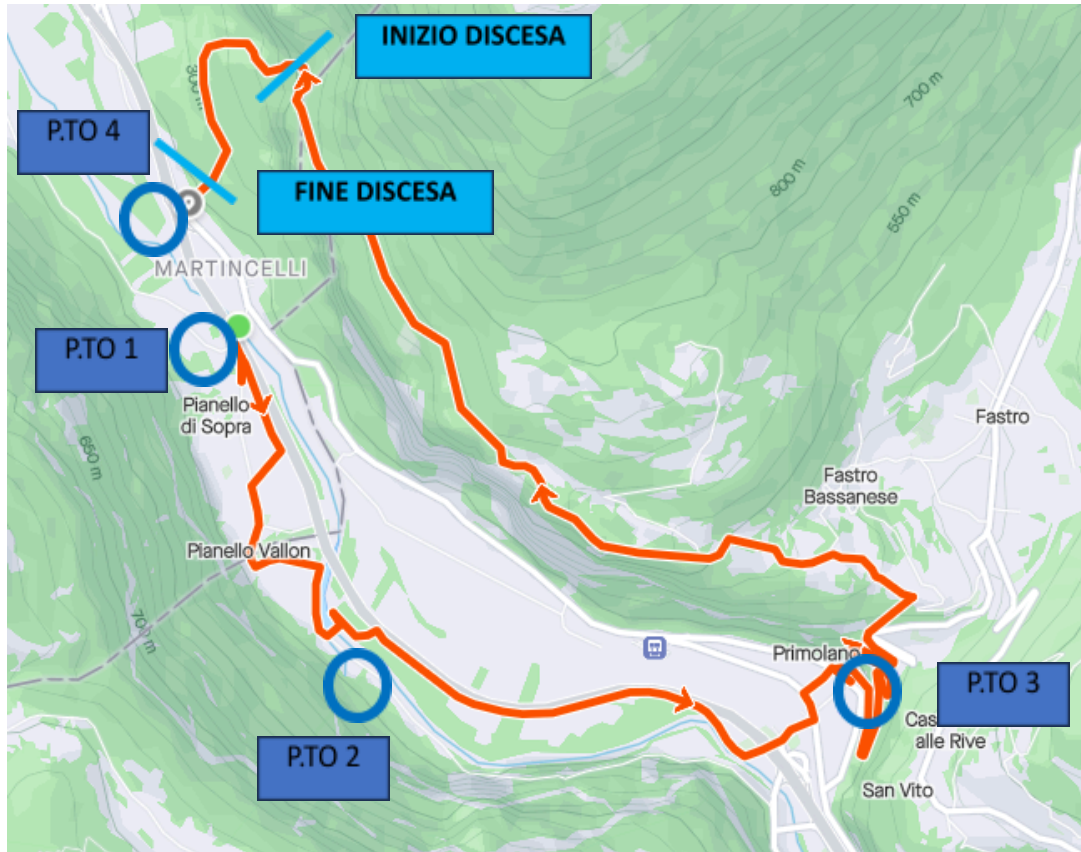
MAPPA PIANELLO VERTICAL RUN