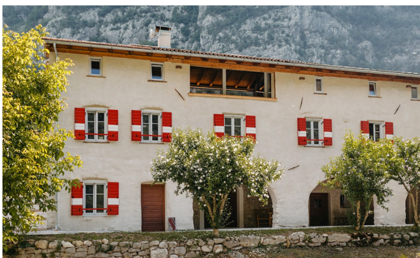
PUNTO 4 – MASO CALCHERA SAN GIORGIO