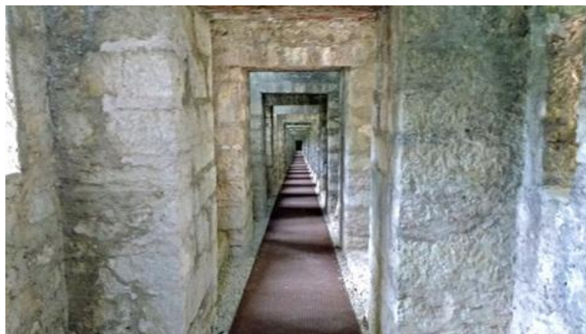
PUNTO 3 – FORTE "TAGLIATA DELLA SCALA"